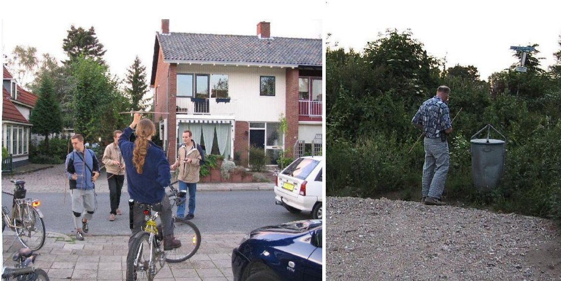
Foto 1.4-2. Links: start vossenjacht. Rechts: zou er een vos bij de vuilnisbak liggen?

Vossenjachten (Foto 1.4-2) zijn een andere vorm van onze hobby. Voor wie er onbekend mee is: de bedoeling is dat je met behulp van een draagbare ontvanger met richtinggevoelige antenne, vaak 'peildoos' genoemd, een verborgen zender of vaker een aantal zenders (vossen) in zo min mogelijk tijd vindt. Vossen jagen is ook goed voor de lichamelijke conditie!